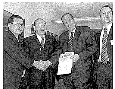
平成20年1月には本会役員らが現地を訪問しました

20年の小金井市、21年の金沢市に次いで7回目。綾部市では2回目となります。平成19年度は、現地的情勢が悪化したことから国内でのプロジェクトを止む無く断念しました。代わりに、本会がプロジェクトを題材にした啓発絵本「平和の種」を制作。本会の役員が現地の学校を訪れ、子どもたちに絵本を贈呈