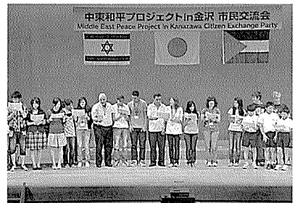
市民交流会で「小さな世界」を合唱。全員の心が一つに