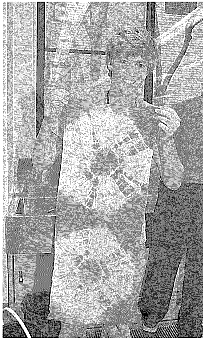
染物体験では、職人顔負けの出来映えに大満足

人口約46万人、昨年市制施行120周年を迎えた金沢市では、平成21年7月30日から8月5日にかけて、紛争で親族を失ったイスラエルとパレスチナの高校生を招待。さまざまな交流事業を行うとともに、世界平和を訴えることを目的に「中東和平プロジェクトin金沢」を実施しました。