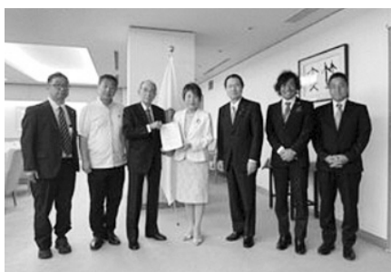
上川陽子外務大臣へ手交

提言の主な内容は以下のとおりです。▽国連改革の議論をスタートさせることを日本政府から呼びかけること。▽ポストSDGsのための資金調達メカニズムとして国際連帯税およびその運用を行う国際機関を創設するための議論を国際的にリードすること。両閣僚からは、「今年の未来サミット、来年の国連創設80周年などを機に、今後の政